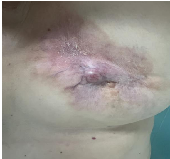
Fig. 1 - Se observa la lesión de la mama izquierda.

logró un control local de esta. Después de 30 días de terminar el tratamiento, reingresó con una adecuada evolución. No se encontró ulceración, solo se observó la retracción mamaria izquierda con bordes irregulares y vascularizada, no ulcerada (fig. 1), por lo que se decidió ingresarla por segunda vez en la institución para realizarle una mastectomía radical con transposición de colgajo de Limberg.